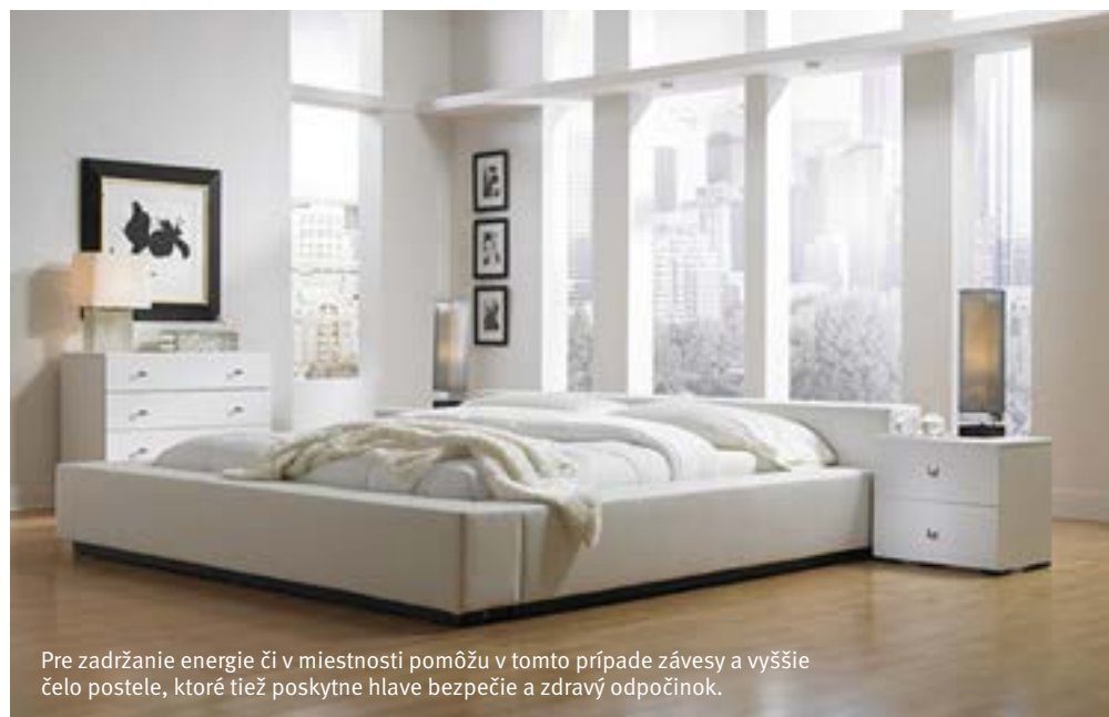
Pre zadržanie energie či v miestnosti pomôžu v tomto prípade závesy a vyššie čelo postele, ktoré tiež poskytne hlave bezpečie a zdravý odpočinok.

skupinu je zase vhodná orientácia na západ, juhozápad, severozápad či severovýchod. Ak je jeden z dvojice z východnej skupiny a druhý zo západnej, treba voliť vyhovujúci smer postele podľa ďalších kritérií. Je vstup do bytu alebo domu orientovaný vhodnejšie pre muža alebo pre ženu? Ak pre ženu, potom posteľ orientujte podľa mužovho Kua čísla a zasa naopak.