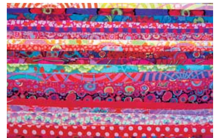
Postupne spájajte jednotlivé pásky do žiadaného celku, zošíte ich a rozžehlíte šivky.