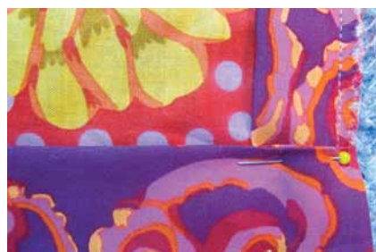
Pásikom olemujte deku (postup pri vytváraní pekného rohu nájdete na mojom blogu), prešite a obstrihajte.