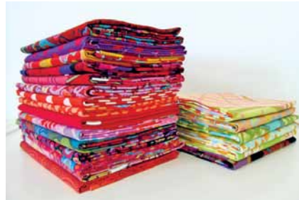
Výber nastrihaných látok Fat Quarters