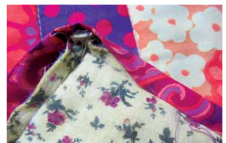
Zo spodnej strany deky je lem prišitý ručne.