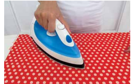
Žehlenie je veľmi dôležité na presné zošívanie kusov látok.