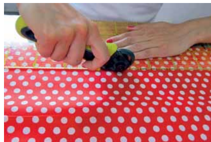
Látky sa režu špeciálnym rezačom na quiltovacej podložke.